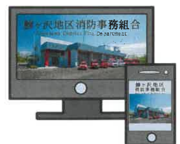
鯉ヶ沢地区消防事務組合のホームページで公表